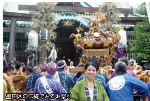
墨田区の伝統であるお祭り

区長 現在、両国地区の魅力の底上げを図り、にぎわいのある町づくりを目指すため、両国まち作り グランドデザイン の策定を進めている。歴史・文化の視点から、水辺や江戸と並び「相撲」も大切だと思う。また、墨田の郷土料理と言える「ちゃんこなべ」を相撲と結び付けながら、国の内外に発信して 両国地区の観光振興 を図っていききたい。